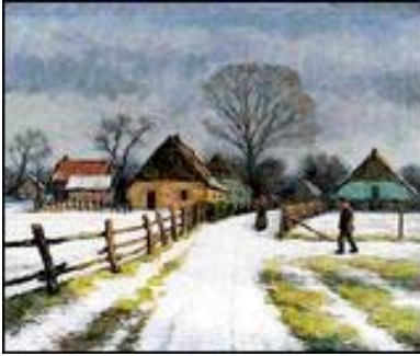
Das Ölbild vom Trommelplatz entstand um 1955.